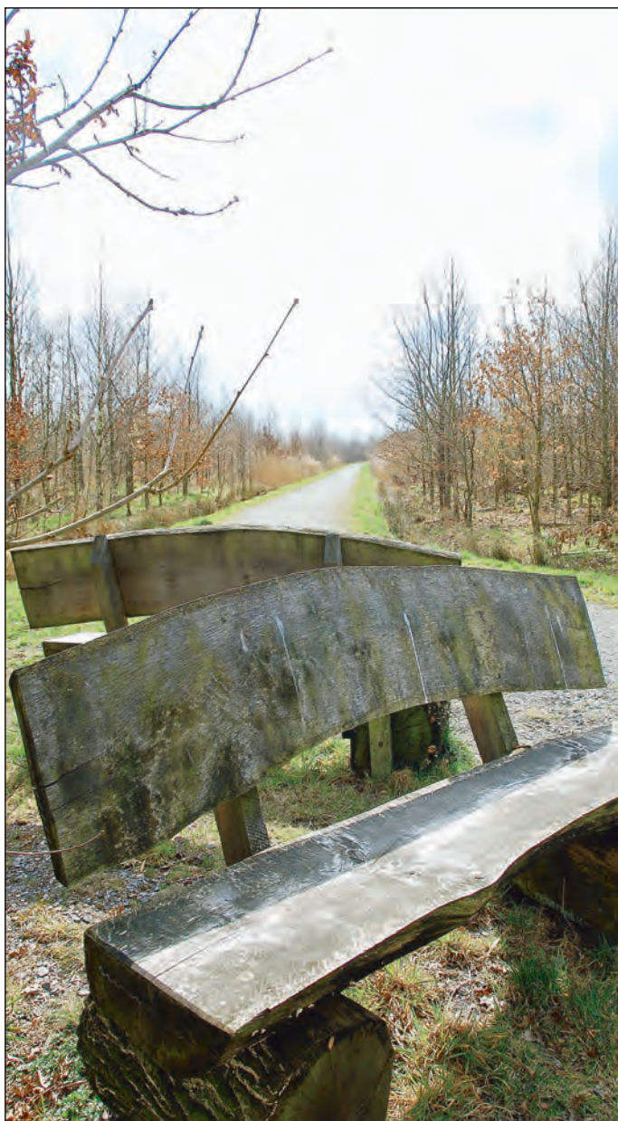
Auch das ist Emden: der Emdener Stadtwald.

„Die Stadt hat zuletzt einen Kinderspielplatz eingerichtet.